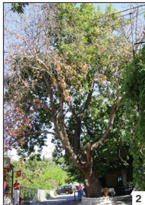
Εικόνες 1-2. Συμπτώματα προσβολής δένδρων πλατάνου από το μύκητα Ceratocystis platani . Εικ. 1: Παρουσία αραιού χλωρωτικού φυλλώματος. Εικ. 2: Νέκρωση κλάδων.