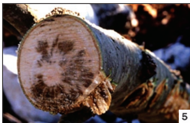
Εικόνες 3-5. Συμπτώματα μεταχρωματισμού του ξύλου δένδρων πλατάνου προσβεβλημένων από τον μύκητα Ceratocystis platani . Εικ. 3: Έλκος και λωρίδες μεταχρωματισμένου ξύλου. Εικ. 4: Λωρίδες μεταχρωματισμένου ξύλου. Εικ. 5: Μεταχρωματισμός ξύλου σε εγκάρσια τομή.