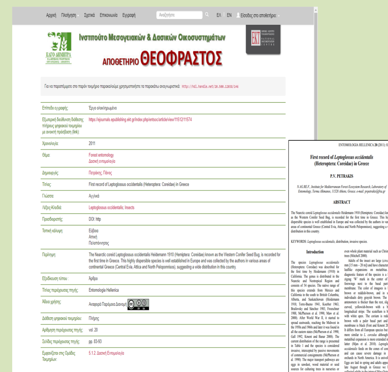
Εικόνα 4. Παράδειγμα αναζήτησης και ανάκτησης τεκμηρίου