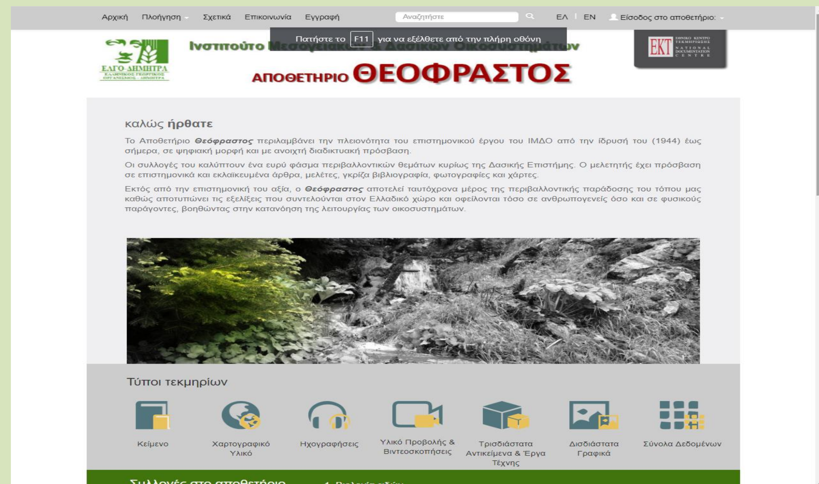
Εικόνα 1. Η αρχική οθόνη του αποθετηρίου «Θεόφραστος»

( http://repository-theophrastus.ekt.gr/theophrastus/ )